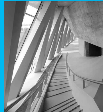
Mercedes-Benz-Museum Stuttgart